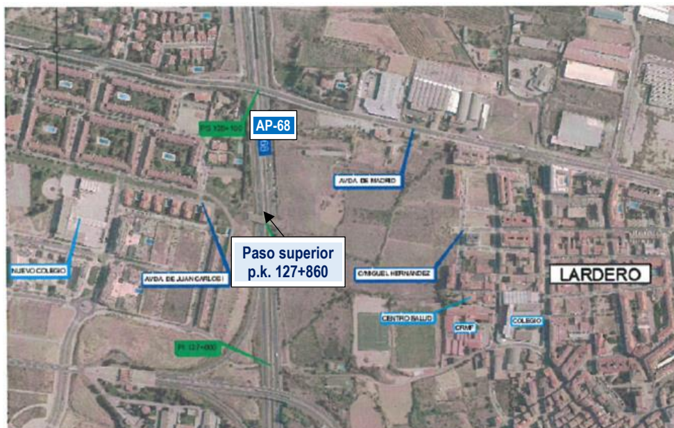
Ubicación de la actuación

La actuación está incluida PRTR, que contempla invertir hasta 357 millones de euros (sin IVA) de los fondos NextGenerationEU para modernizar más de 80 túneles y potenciar la protección de la fauna y usuarios vulnerables en la Red de Carreteras del Estado mediante actuaciones distribuidas por toda la geografía nacional.