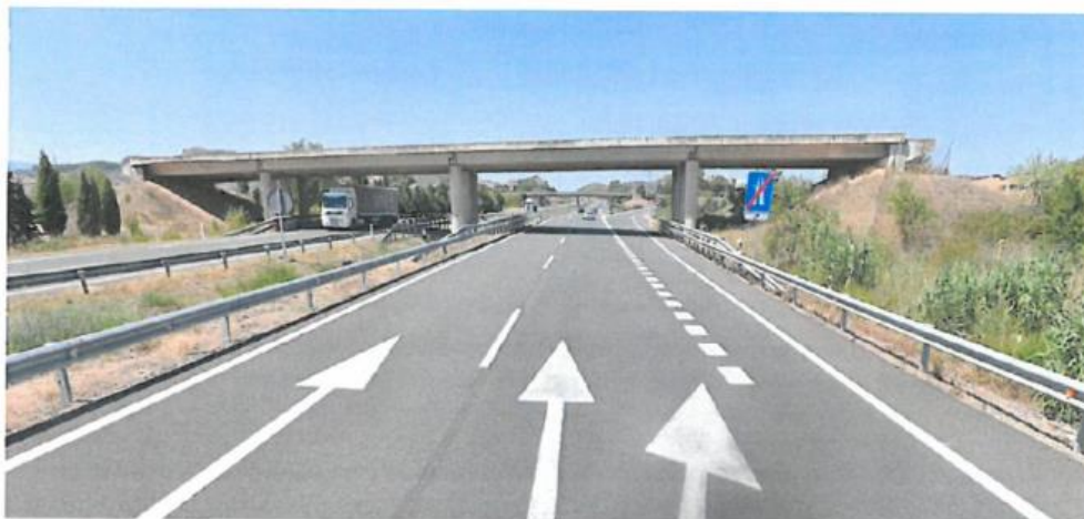
Vista del paso superior del P.K. 127+860 desde la AP-68, sentido Bilbao