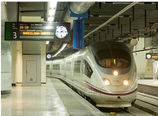
Un tren de alta velocidad en la estación de Barcelona-Sants

Otro de los hitos a los que han asistido los ciudadanos de Catalunya en este semestre es el impulso proyecto de la nueva estación intermodal de La Sagrera, en Barcelona, que tras la puesta en marcha de los primeros trámites administrativos, está llamada a ser un centro de movilidad de primer orden en el área de Barcelona (se prevé que la usen 100 millones de viajeros al