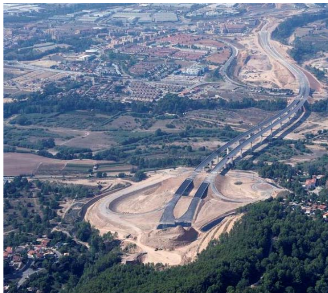
Autovía B-40, entre Abrera y Olesa de Montserrat

También seguirán adelante las actuaciones en la A-7, y se dará el impulso definitivo a la A-22 entre Lleida y la provincia de Huesca. Se asegurarán además las conexiones con Francia al continuar invirtiendo en la A-2 (Tordera-frontera) y la A-14 desde Lleida.