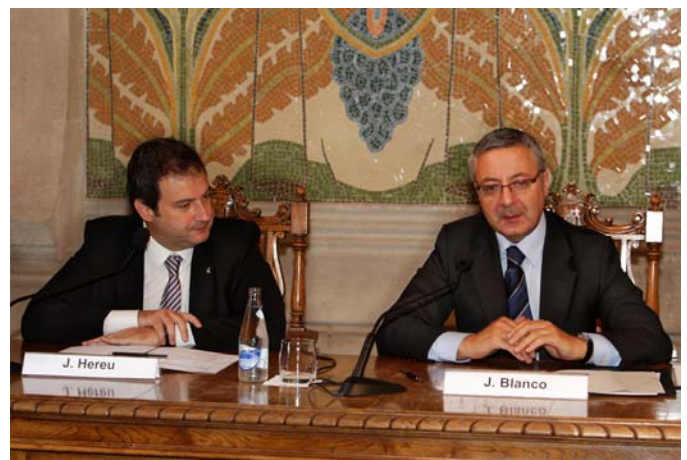
El alcalde de Barcelona, Jordi Hereu, junto a José Blanco

En los últimos meses Fomento ha destinado decenas de millones de euros a diversos proyectos para la recuperación del patrimonio histórico en Catalunya, y ha firmado además nuevos convenios, todos ellos con cargo al 1% Cultural.