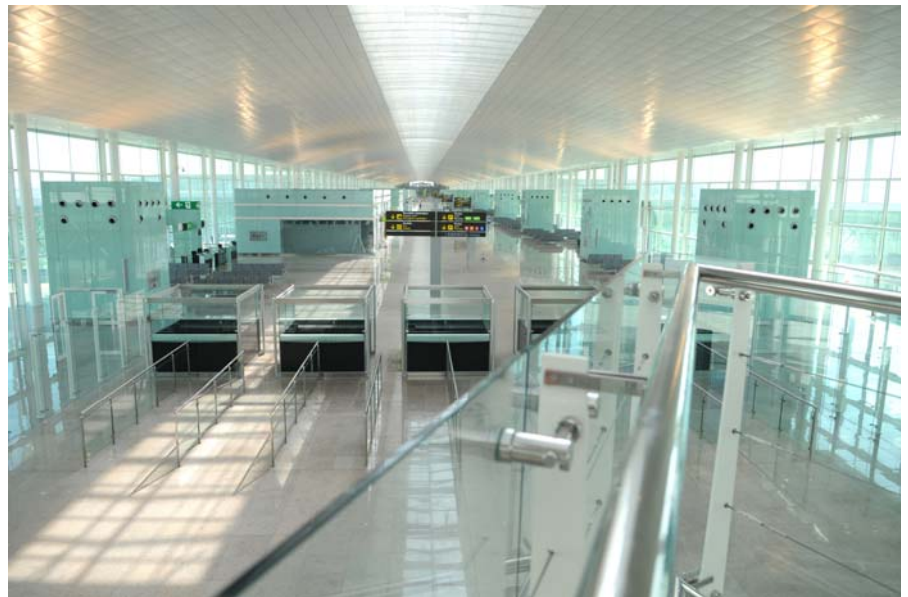
Nueva terminal T-1, en el aeropuerto de El Prat

Con 544.000 metros cuadrados de superficie, la nueva T-1 tiene capacidad para dar servicio a 90 operaciones cada hora en sus 101 puertas de embarque. Estas características le permiten dar servicio a 30 millones de pasajeros al año, elevando la capacidad total del aeropuerto hasta los 50 millones de viajeros anuales.