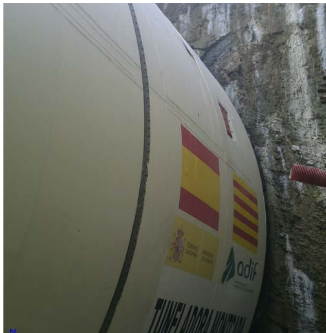
Máquina tuneladora para la línea Barcelona-Figueres

Por lo que respecta a la alta velocidad, 2010 será el año del impulso definitivo a todos los tramos del Corredor Mediterráneo en territorio catalán (entre Camp de Tarragona y Vandellós), y de la apertura al tráfico de varios tramos de la línea de alta velocidad Barcelona-Perpignan, que permitirá conectar por primera vez el puerto de Barcelona con Francia en ancho internacional, gracias a la instalación de tercer carril en varios tramos entre Girona y Figueres. En 2010 además avanzarán las obras del nuevo túnel para alta velocidad bajo Barcelona, y comenzarán las de la futura estación de La Sagrera.