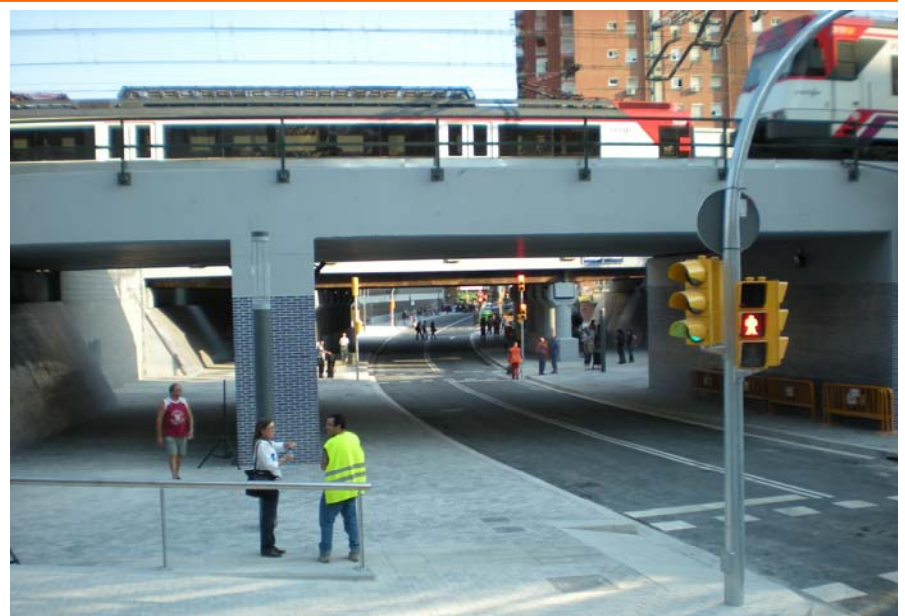
Así ha quedado la Riera Blanca, entre Barcelona y L'Hospitalet, tras la reforma

El esfuerzo inversor en materia de ferrocarriles que está realizando Fomento en el territorio de Catalunya no se limita al tendido de nuevas infraestructuras o a la mejora de otras ya existentes. Tanto en el marco de las obras relacionadas con las nuevas líneas de alta velocidad como en las relativas a la red convencional y a la malla de Rodalies de Barcelona, son decenas las actuaciones en marcha para integrar el ferrocarril en los núcleos urbanos que atraviesa. Entre ellas destacan los planes de soterramiento del ferrocarril en Girona, que se ejecutan al mismo tiempo que la nueva línea Barcelona-Perpiñán, o de la C-2 en L'Hospitalet, así como la reciente rehabilitación de la Riera Blanca, entre ésta localidad y la ciudad condal.