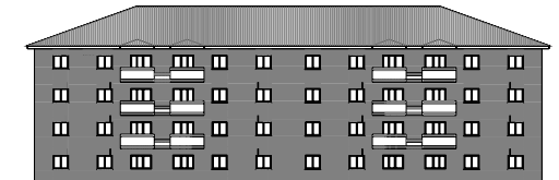
ALZADO POSTERIOR EDIFICIO C