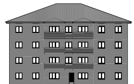
ALZADO POSTERIOR EDIFICIO B