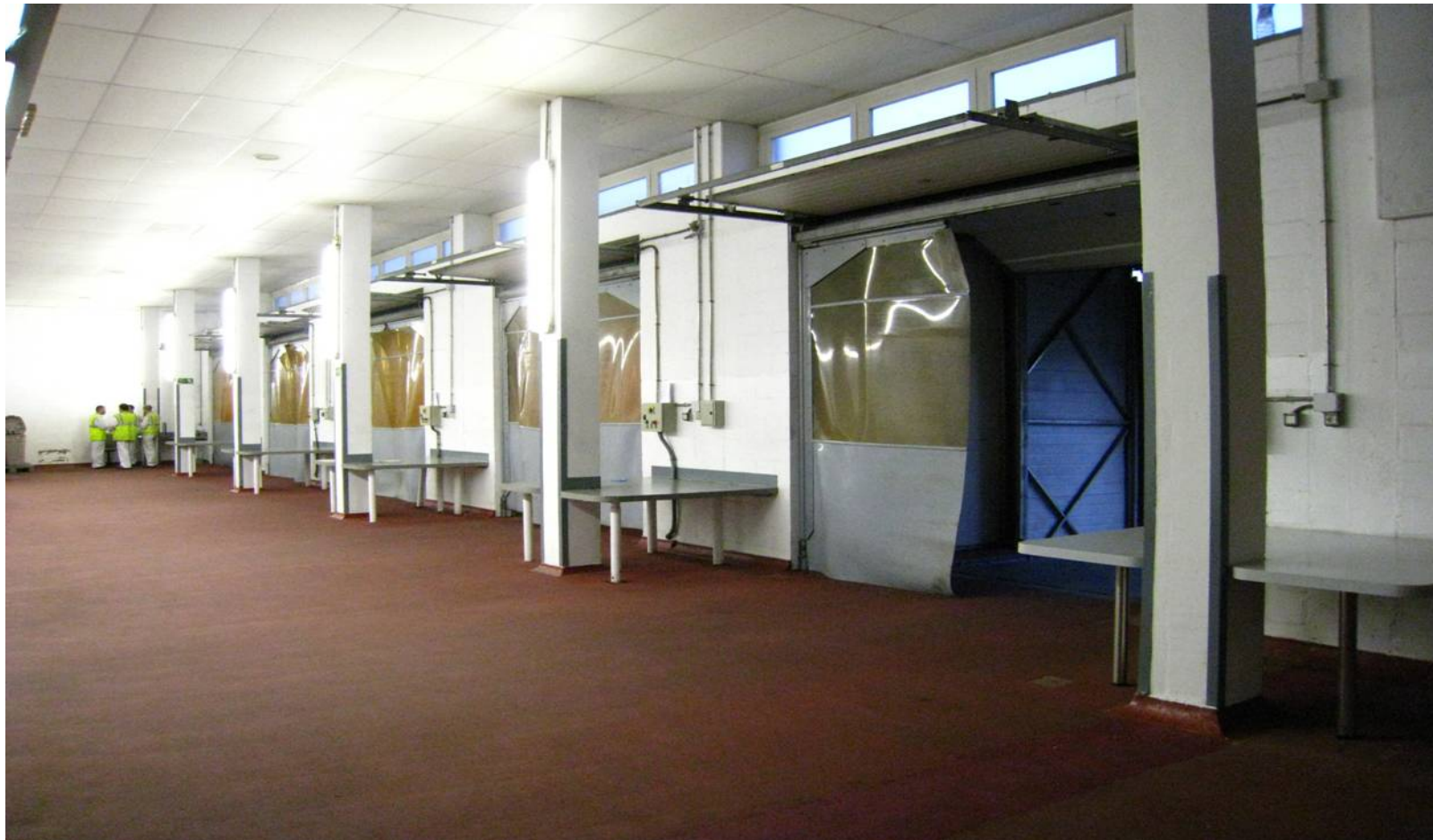
Instalaciones del PIF del Puerto de Barcelona

DELEGACIÓN DEL GOBIERNO EN CATALUNYA DELEGACIÓ DEL GOVERN A CATALUNYA SUBDELEGACIÓN DEL GOBIERNO EN BARCELONA SUBDELEGACIÓ DEL GOVERN A BARCELONA