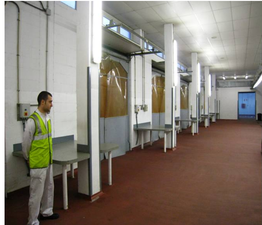
Instalaciones del PIF del Puerto de Barcelona