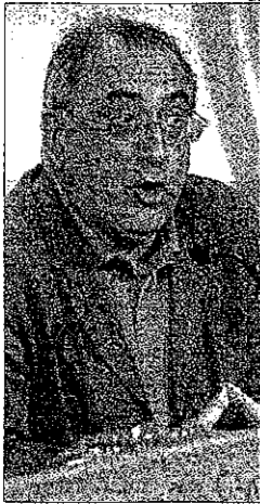
Nadal estuvo ayer en Madrid