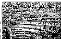
El document del govern que inclou la proposta de 44.263 milions. R. R.

Sorpresa Finalment, la subcomissió no es va reunir a aquell dilluns i