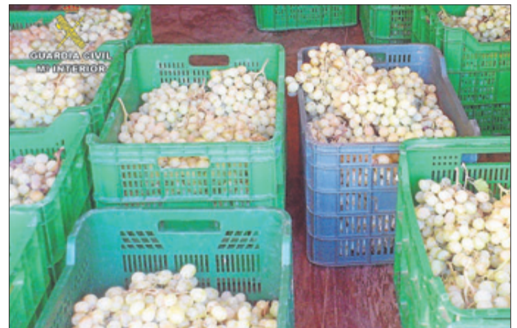
La operación de la Guardia Civil ha detenido a 25 personas.

Las investigaciones se iniciaron el pasado septiembre por especialistas de los Equipos Roca (Contra Robos en el Campo) y de las unidades de investigación de la Benemérita, cuando tuvieron conocimiento de la sustracción de gran cantidad de uva de mesa en una finca de Totana, y tras varias averiguaciones se procedió a la identificación, localización y detención de los cinco integrantes de un clan familiar como presuntos autores de los delitos de robo y hurto de productos del campo.