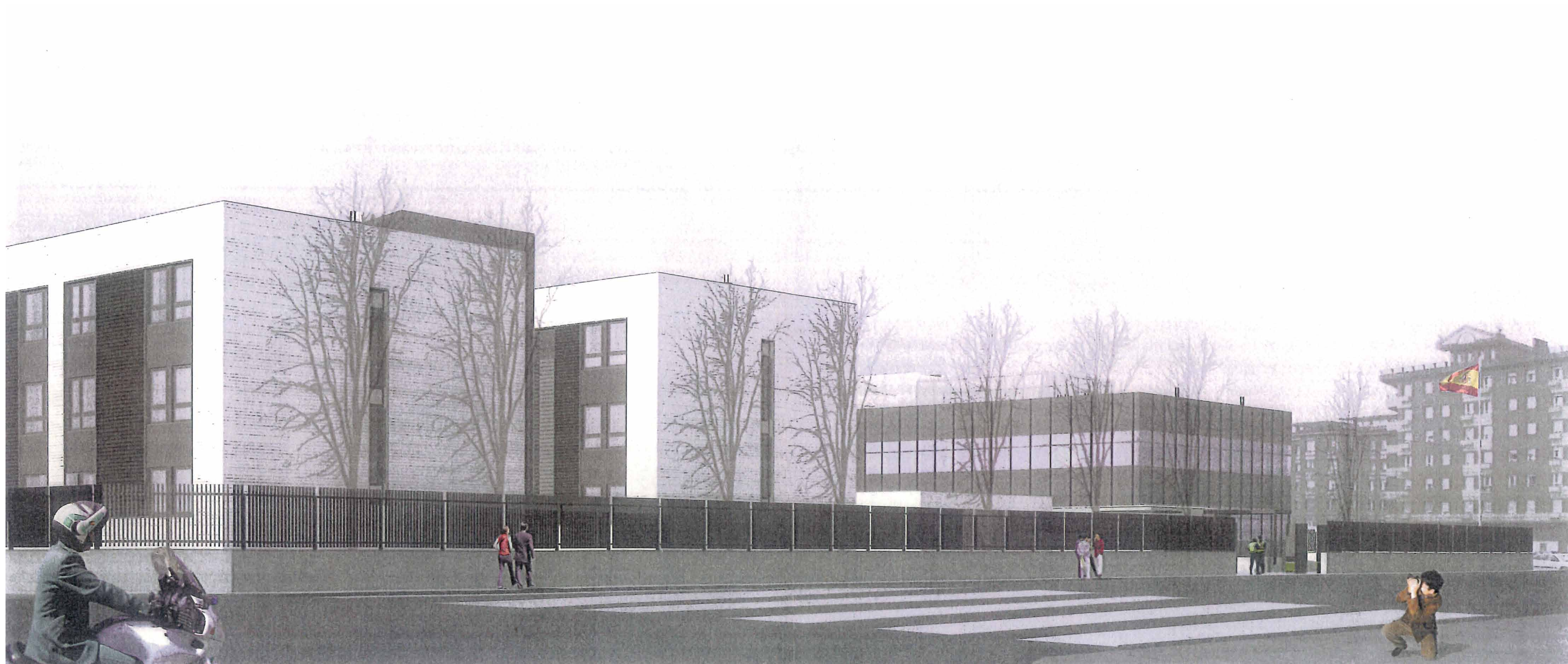
Entrada Nuevo Cuartel. (Calle Siero)