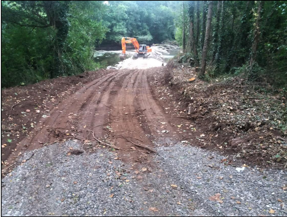
Inicio de las actuaciones