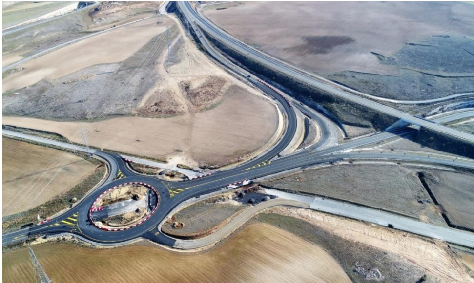
Enlace con la N-110